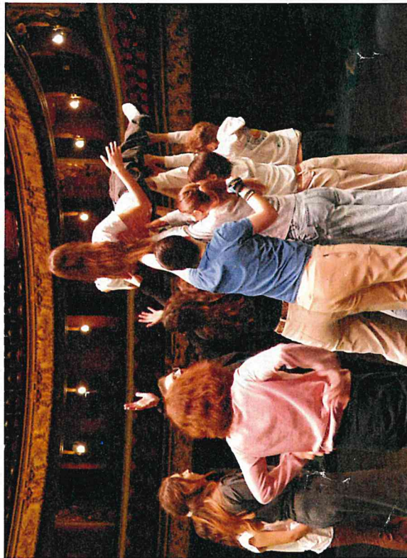
Projet : Dis-le avec ton corps - Répétition sur la scène du théâtre à l'italienne.